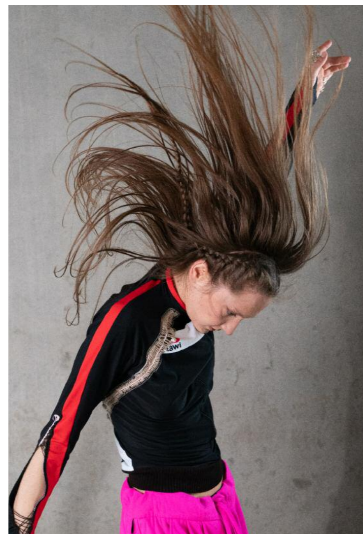
Vizuál Bread & Dance Prague 2025