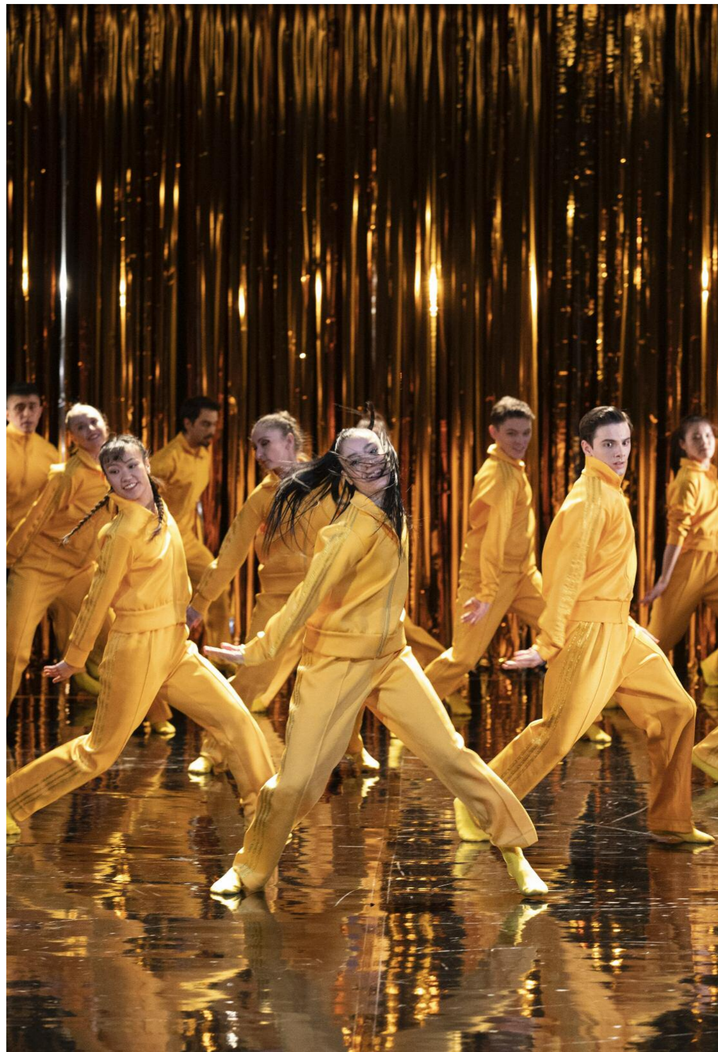
BURKICOM: Mladí, krásní a navždy, foto: Michaela Karásek Čejková

Scénář, režie, choreografie Jana Burkiewiczová, asistentka choreografky: Paulína Šmatláková, dramaturgie, text: Martina Kinská, hudba Jiří Konvalinka, scénografie Marek Cpin, světelný design Karlos Šimek. fotografie: Michaela Karásek Čejková, tanečníci: Soubor baletu Jihočeského divadla v Českých Budějovicích.