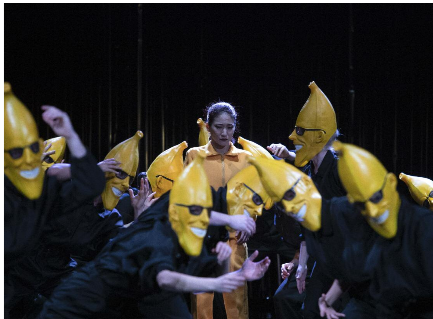
Mladí, krásní a navždy

Díky rostoucímu počtu hraní a také díky vlastní kreativní činnosti pro další subjekty jsme tak vedle základního sedmičlenného týmu přinesli práci 25 performerům, 12 tvůrčím profesionálům a více jak 10 produkčním, technickým a dalším spolupracovníkům. Na naší činnosti se v roce 2025 podílelo více jak 50 lidí.